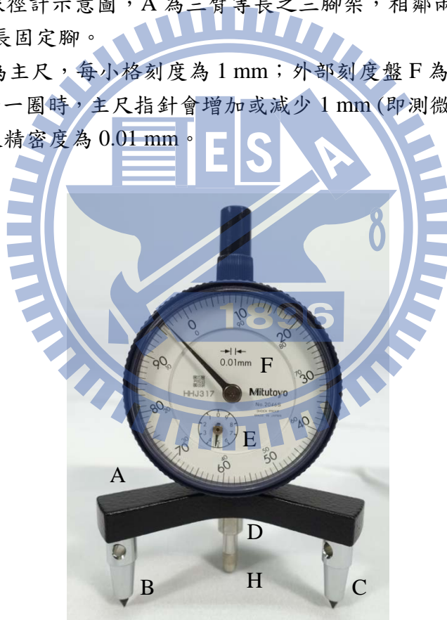
圖一 球徑計構造圖

內部刻度盤 E 為主尺，每小格刻度為 1 mm；外部刻度盤 F 為副尺，共分成 100 等分。當副尺指針轉動一圈時，主尺指針會增加或減少 1 mm (即測微探針 H 伸長或內縮 1 mm)，故可判定副尺精密度為 0.01 mm。